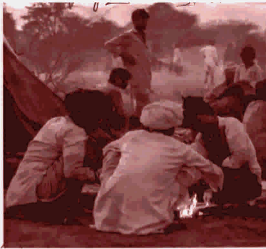
വിദ്യാലയത്തിൽ പിന്നാക്കം നിൽക്കുന്ന ശ്രാമീണർ, മറ്റൊന്നും ചെയ്യാനില്ലാത്തപ്പോൾ പുറം വെളിച്ചം നേടാനുള്ള ശ്രമം.