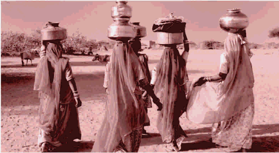
വീട്ടവശ്യത്തിനുള്ള വെള്ളത്തിനായി അനേകം മൈലുകൾ നടന്നു പോകുന്ന സ്ത്രീകൾ