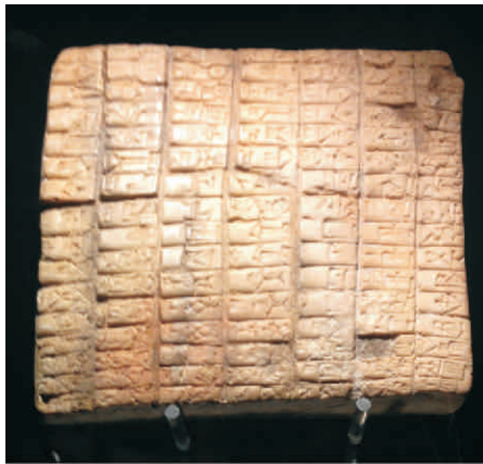
Picture: Ebla Tablet

The discovery of these biblical names among the Ebla tablets provides important evidence for the historical reliability of the Bible and supports the idea that the Bible accurately reflects the cultural and historical background of the ancient Near East. The Ebla tablets also provide a rich source of information for those interested in exploring the historical and cultural background of the Bible and the wider ancient Near East.