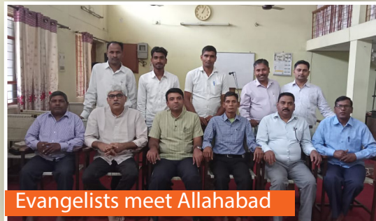
Evangelists meet Allahabad