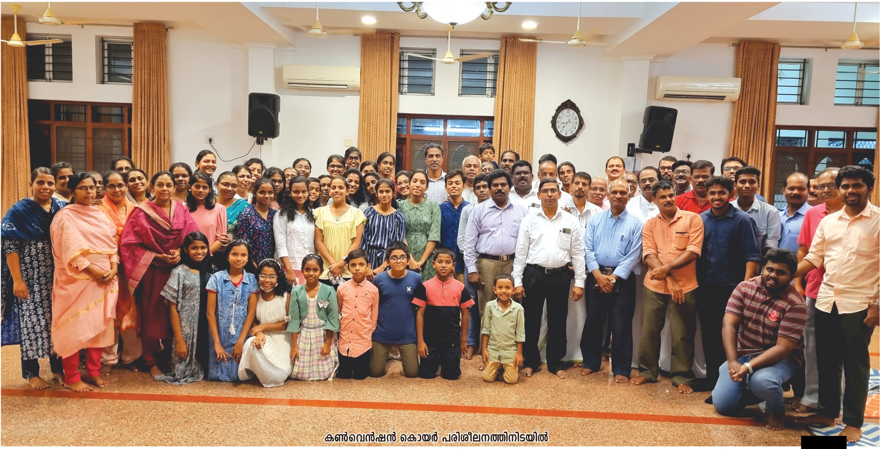
കൺവെൻഷൻ കയർ പരിശീലനത്തിനിടയിൽ