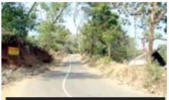
വന വഴികൾ - 47