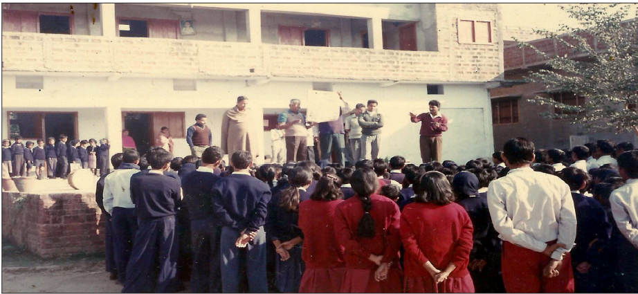
സുവിശേഷം ശ്രദ്ധിക്കുന്ന സ്കൂൾകുട്ടികളും അധ്യാപകരും