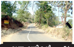
വന്ന വഴികൾ - 51