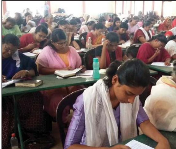
ബൈബിൾ റിസേർച്ച് സെന്ററിന്റെ ചുമതലയിൽ കല്ലിശ്ശേരി ബി.ബി.സി. ഓഡിറ്റോറിയത്തിൽ മെയ് 6 വെള്ളി രാവിലെ 10 ന് നടന്ന പുറപ്പാട് പുസ്തക ബൈബിൾ കിസിൽ പങ്കെടുത്തവർ