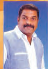
R. Noble Music

Good News Audio Akkulam Road, Trivandrum - 695 011 0471-2542870 annjohn@gnmindia.org www.gncs.org