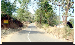
വന വഴികൾ - 38