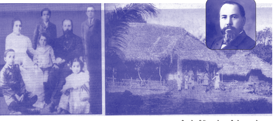
നാഗലും കുടുംബവും കുറുംകുളത്തെ നാഗലിന്റെ വീട്; ഇൻസെന്റിൽ നാഗൽ