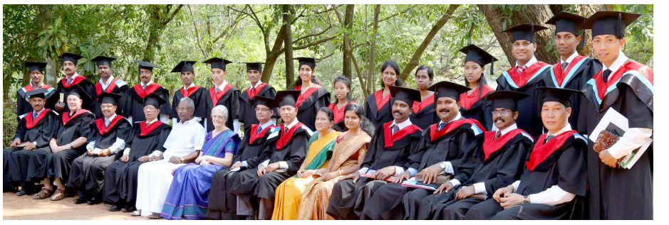
ഗ്രാഡുവേഷൻ : ആർ.റ്റി.ഐ. കഴിഞ്ഞ ബാച്ചിലെ വിദ്യാർത്ഥികളും അധ്യാപകരും മിസ്. ട്രഷററോടൊപ്പം

ചില വർഷങ്ങളിൽ 200-ഓളം കുട്ടികൾ ഉണ്ടായിരുന്നു; ഇപ്പോൾ ഈ സ്ഥാപനം 150-ൽ പരം