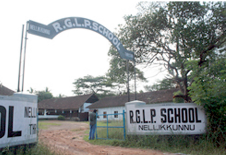
റഹബോത്ത് ഗേൾസ് എൽ.പി.സ്കൂൾ അതിന്റെ വിശാലമായ ചുമുഖത്ത് അവർ തങ്ങളുടെ സകാര്യ ദുഃഖങ്ങളെല്ലാം മറന്ന് ഓടിക്കളിച്ചു. പെറ്റമ്മ മരണാലും മരക്കാത്ത ദൈവസ്നേഹത്തിന്റെ ആഴം അവർ മനസ്സിലാക്കി.