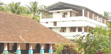
1906 - ൽ പണിത ആദ്യകെട്ടിടം; പിന്നിൽ പുതിയത് നൂണ്ടായിരുന്നു. മമ്മി അവളുടെ കണ്ണീരൊപ്പി; എന്തോ പറഞ്ഞു. അവൾ അവളുടെ അമ്മയെ കണ്ടെത്തിക്കഴിഞ്ഞിരുന്നു.)

18 വയസ്സു കഴിഞ്ഞാൽ നിയമപ്രകാരം കുട്ടികളെ പിന്നെ ഇവിടെ നിർത്താനാവില്ല. പഠനത്തിനു മികവു തെളിയിക്കുന്നവരെ അവരുടെ അഭിരുചിക്കൊത്തവണ്ണം ഉപരിപഠനത്തിനായി അയയ്ക്കുന്നു. ഇപ്പോൾ ഫാർമ സിയിൽ ഡോക്ട്രേറ്റ് ചെയ്യുന്ന ഒരു കുട്ടിയുണ്ട്, മറ്റു ചിലർ എൻജിനീയറിംഗ്, ബി.എസ്സി. നഴ്സിംഗ്, എൽ.എൽ.ബി., ബി.എഡ്. തുടങ്ങിയ പ്രൊഫഷണൽ കോഴ്സുകൾക്കു പഠിക്കുന്നു. ചിലർ തയ്യൽ പരിശീലനം നേടുന്നു. വിവാഹ പ്രായമാകുമ്പോൾ അവരെ വിവാഹം കഴിപ്പിച്ച് അയക്കുവാൻ റഹബോത്ത് മുൻകൈയെടുക്കുന്നു. ഏറെ പേരും സുവിശേഷകന്മാരുടെ ഭാര്യമാരായി ഭാരതത്തിന്റെ വിവിധ സംസ്ഥാനങ്ങളിൽ