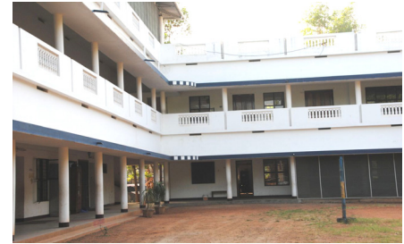
ഇന്റർനാഷണൽ സ്കൂളിന്റെ പ്രധാന കെട്ടിടം