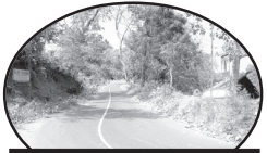
വന്ന വഴികൾ - 20