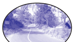
വന്ന വഴികൾ - 5