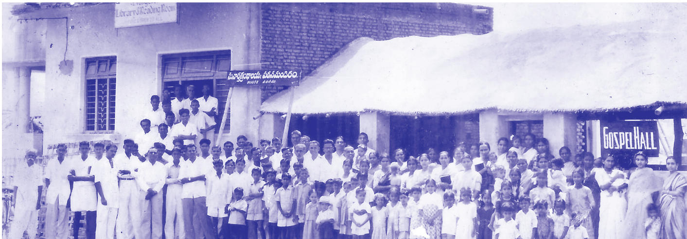
സഭാഹാളിനോട് ചേർന്ന് റീഡിംഗ് റൂമിന് മുമ്പിൽ സഭാവിശ്വാസികൾ

ലൈബ്രറി റീഡിംഗ് റൂമിന്റെ പ്രവർത്തനത്തോടു കൂടിയ ലക്കത്തിൽ പറഞ്ഞിരുന്നില്ല. പുതിയതായി വന്ന് വചനം പഠിക്കുന്നതിനുള്ള സൗകര്യവും അവിടെ ഉണ്ടായി. വൈകിട്ടുള്ള സമയങ്ങളിൽ പതിവായി കുറെ യുവാക്കളാൽ വചനം പഠിപ്പിക്കുവാൻ കർത്താവ് എന്നെ ബലപ്പെടുത്തി. അങ്ങനെ വചനം പഠിച്ച യുവാക്കളുടെ ഫോട്ടോ ഇതോടൊന്നിച്ചു കാണാം. ചില കാരണങ്ങളാൽ റീഡിംഗ് റൂം പിന്നീട് സഭാഹാളിനോടു ചേർന്ന ഒരു മുറിയിലേക്കു മാറ്റിവാനിടയായി. അപ്പോൾ സന്ദർശകർ കുറവായി. റീഡിംഗ് റൂം പ്രവർത്തനം എങ്ങനെ ഫലകരമായി ഉപയോഗപ്പെടുത്തണമെന്ന കാര്യം വായനക്കാരുടെ ശ്രദ്ധയിൽ കൊണ്ടു വരുവാനാണ് ഇത്രയും എഴുതിയത്.