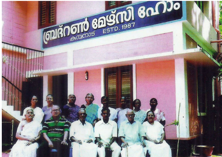
ഭവനാഗങ്ങൾ (2014 മാർച്ച്)

കുമ്പനാട്: ബ്രദറൺ മേഴ്സി ട്രസ്റ്റിന്റെ ആഭിമുഖ്യത്തിൽ കുമ്പനാട് പ്രവർത്തിക്കുന്ന ബ്രദറൺ മേഴ്സിഹോം 2013-14 ലെ വാർഷിക റിപ്പോർട്ടും ആഡിറ്റ് ചെയ്ത വരവു - ചെലവു കണക്കുകളും പ്രസിദ്ധീകരിച്ചിരിക്കുന്നു. നമ്മുടെ ഇടയിലുള്ള നിരലംബരും വാർദ്ധക്യത്തിന്റെ ബലഹീനതയിൽ കഴിയുന്നവരുമായ സഹവിശ്വാസികളെ സൗജന്യമായി സംരക്ഷിക്കുന്ന സ്ഥാപനമാണ് മേഴ്സിഹോം. 1-3-1987-ൽ വാടക കെട്ടിടത്തിൽ ആരംഭിച്ച് 22-5-91 മുതൽ സ്വന്തമായ കെട്ടിടത്തിൽ പ്രവർത്തിച്ചു വരികയാണ്. കൂടുതൽ അപേക്ഷകരെ ഉൾക്കൊള്ളുന്നതിന് വേണ്ടി കാലാകാലങ്ങളിൽ ഫണ്ടിന്റെ ലഭ്യത അനുസരിച്ച് വികസനപ്രവൃത്തികൾ ചെയ്തു വാൻ കർത്താവ് കൃപ ചെയ്തു. കേരളത്തിന്റെ വിവിധ ഭാഗങ്ങളിൽ നിന്നുള്ള 45 പേർ അടങ്ങുന്ന പൊതു സമിതിയിൽ നിന്നും വർഷം തോറും തിരഞ്ഞെടുക്കുന്ന 11 അംഗ ഭരണസമിതിയുടെ