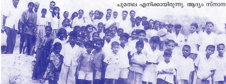
തലകാശിപ്പള്ളി ഗ്രാമത്തിൽ നടന്ന സ്നാനശുശ്രൂഷയ്ക്ക് സാക്ഷ്യം വഹിച്ചവർ

ലൈബ്രറി റീഡിംഗ് റൂമിന്റെ പ്രവർത്തനത്തോടു കൂടിയ ലക്കത്തിൽ പറഞ്ഞിരുന്നില്ല. പുതിയതായി വന്ന് വചനം പഠിക്കുന്നതിനുള്ള സൗകര്യവും അവിടെ ഉണ്ടായി. വൈകിട്ടുള്ള സമയങ്ങളിൽ പതിവായി കുറെ യുവാക്കളാൽ വചനം പഠിപ്പിക്കുവാൻ കർത്താവ് എന്നെ ബലപ്പെടുത്തി. അങ്ങനെ വചനം പഠിച്ച യുവാക്കളുടെ ഫോട്ടോ ഇതോടൊന്നിച്ചു കാണാം. ചില കാരണങ്ങളാൽ റീഡിംഗ് റൂം പിന്നീട് സഭാഹാളിനോടു ചേർന്ന ഒരു മുറിയിലേക്കു മാറ്റിവാനിടയായി. അപ്പോൾ സന്ദർശകർ കുറവായി. റീഡിംഗ് റൂം പ്രവർത്തനം എങ്ങനെ ഫലകരമായി ഉപയോഗപ്പെടുത്തണമെന്ന കാര്യം വായനക്കാരുടെ ശ്രദ്ധയിൽ കൊണ്ടു വരുവാനാണ് ഇത്രയും എഴുതിയത്.