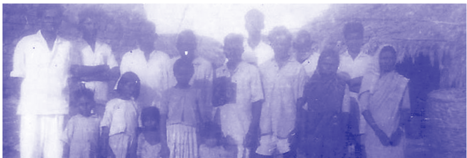
തലകാശിപ്പള്ളി ഗ്രാമത്തിലെ സഭാവിശ്വാസികൾ

ഈ പുതിയ കൂടിവരവും സാക്ഷ്യവും അവരുടെ ബന്ധുക്കളും പരിചയക്കാരുമായി സമീപ ഗ്രാമങ്ങളിലുണ്ടായിരുന്നവരുടെയും ശ്രദ്ധാവിഷയമായിത്തീർന്നു. അടുത്ത് രണ്ടു ഗ്രാമങ്ങളാണുണ്ടായിരുന്നത്. തിമ്മം