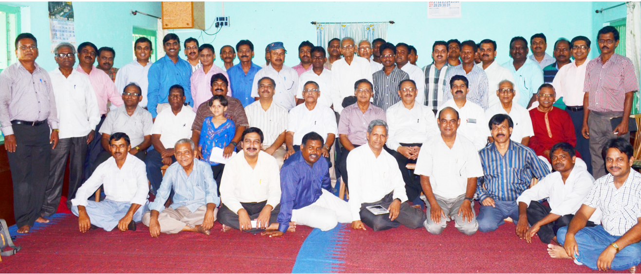
യോഗത്തിൽ പങ്കെടുത്തവർ കേരളത്തിൽ നിന്നുള്ള പ്രതിനിധികളോടൊപ്പം

അങ്കമാലി: ഹരിയാന കാമ്പയിനു ശേഷം അടുത്ത ടീം പ്രവർത്തനം എവിടെയായിരിക്കണം എന്ന വിഷയത്തിൽ ഭാരവാഹികൾ പ്രാർത്ഥിച്ചു കൊണ്ടിരുന്നു. ദൈവഹിതം തിരിച്ചറിയാൻ ദൈവമക്കളുടെ പ്രാർത്ഥനയും സഹായകരമായിരുന്നു. ബംഗാളിൽ നിന്നു “കടന്നുവന്നു ഞങ്ങളെ സഹായിക്കൂ” എന്ന മക്കദോന്യവിലിയും ഈ അവസരത്തിൽ ലഭിക്കുകയുണ്ടായി. 1992-93 വർഷങ്ങളിലാണ് നാം ബംഗാളിൽ പ്രവർത്തിച്ചത്. 19 ജില്ലകളിൽ ഒരു മാസം ഒരു ജില്ലയിൽ എന്ന നിലയിൽ പ്രവർത്തിച്ചിരുന്നു. എന്നാൽ ബംഗാളിലെ