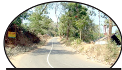
വന്ന വഴികൾ - 3