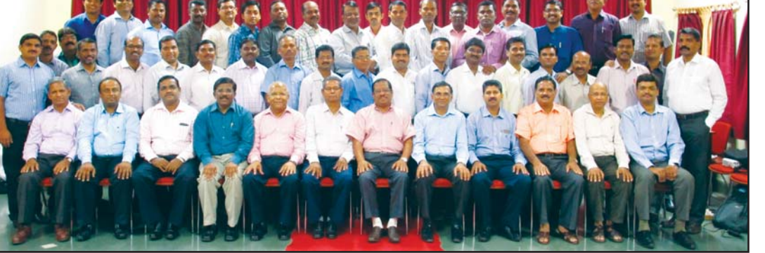
സമ്മേളനത്തിൽ പങ്കെടുത്തവർ ശുശ്രൂഷകന്മാർക്ക് ഒപ്പം (വാർത്ത 7-ാം പേജിൽ)