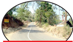
വന്ന വഴികൾ - 2