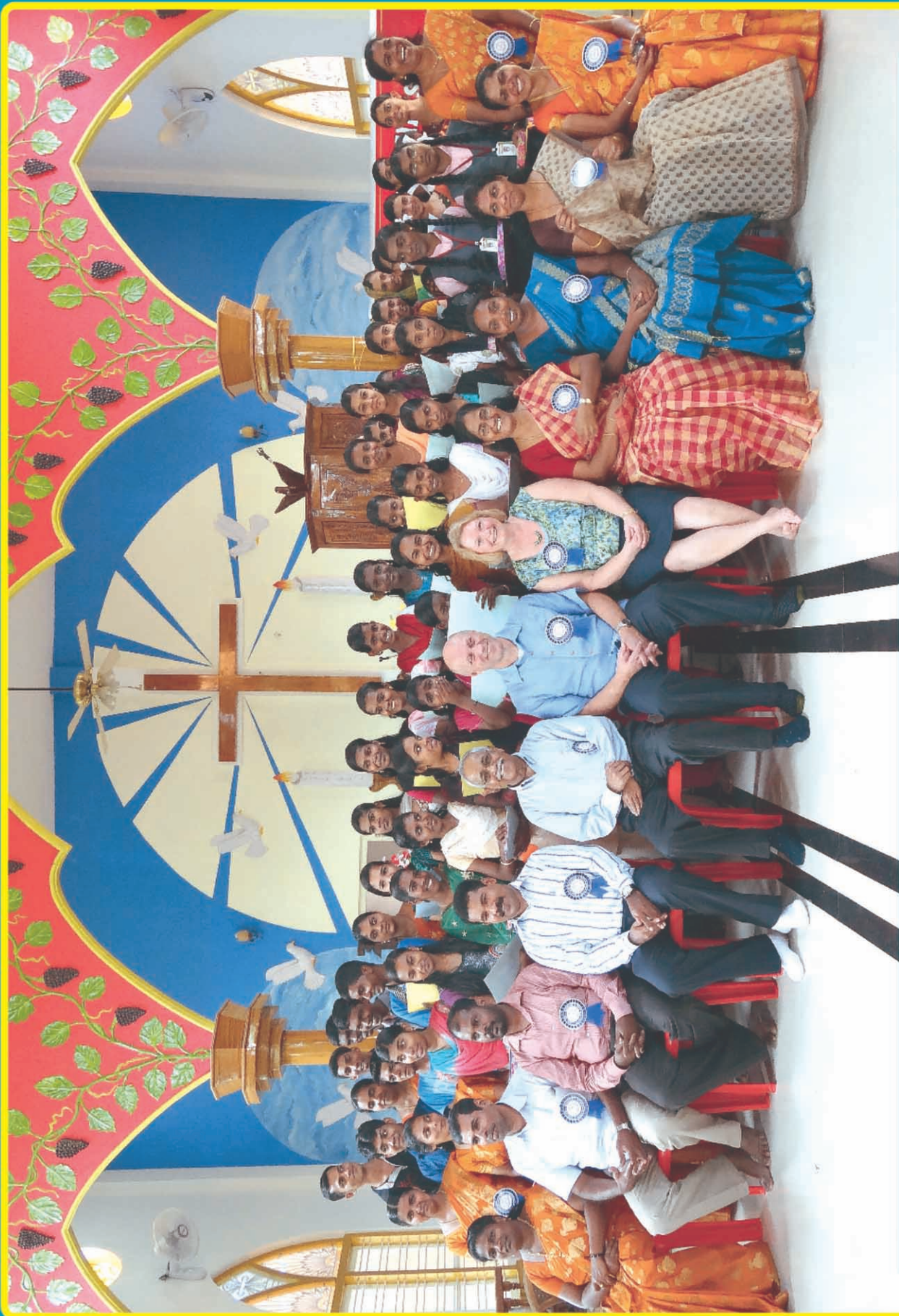
ഗുഡ് ന്യൂസ് മിനിസ്ട്രീസിന്റെയും അമ്പുരി അന്യഗ്രഹ CDC യുടേയും സംയുക്താഭിമുഖ്യത്തിൽ ഫെബ്രുവരി 22, 2014 അമ്പുരി CSI പരിഷ്കരിച്ചു വെച്ചു നടത്തപ്പെട്ട ഗുഡ് ന്യൂസ് കരസ്ഥാക്കലിന് സുകുളിന്റെ ഗ്രാഡുവേഷൻ സർട്ടിഫിക്കറ്റിൽ നിന്നുള്ള ഒരു ദൃശ്യം. (ഇരിക്കുന്നവർ- ഗുഡ് ന്യൂസിന്റെയും, CDC യുടെയും ലീഡർസ്. നിൽക്കുന്നവർ- ഗുഡ് ന്യൂസ് കരസ്ഥാക്കലിന് കോഴ്സ് വിജയകരമായി പൂർത്തിയാക്കിയിട്ടുള്ളവർ)