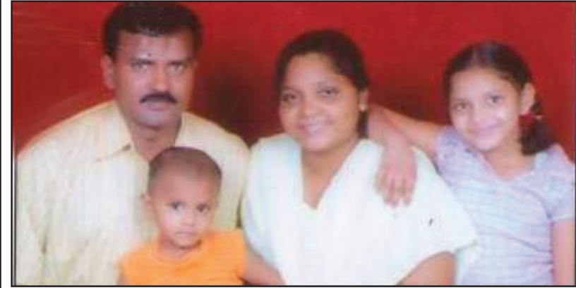
അമൃതസരിൽ സുവിശേഷവേല ചെയ്യുന്ന വിജയ് രാജുവും കുടുംബവും

Justin M. Zachariah, P.O. Box. 77, Patiala, Punjab - 147001 Mob : 09417734245