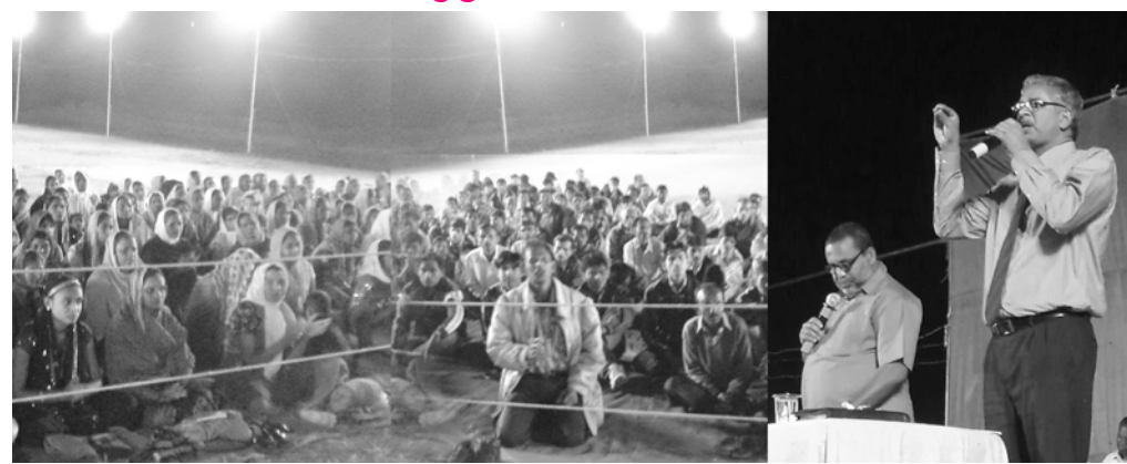
മെഗാ കൺവെൻഷനിൽ ഫിലിപ്പ് കുട്ടി ദൈവവചനം ശുശ്രൂഷിക്കുന്നു