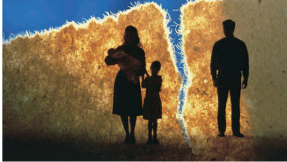
ആത്യന്തികഫലമെന്നതു ദൈവനാമം ദുഷിക്കപ്പെടുന്നു എന്നത്രേ.

വിശ്വാസികളുടെയിടയിൽ വിശ്വാസ വഞ്ചന ഏറ്റവുമധികം നടമാടുന്ന വേദിയാണ് വിവാഹം. മാനസിക വിഭ്രാന്തി, ശാരീരിക ന്യൂനതകൾ, അനാത്മീകത തുടങ്ങി ഒരു വിശ്വാസിയുടെ വിവാഹത്തിനുള്ള തടസ്സങ്ങളെ മുടിവച്ച് ചിലരെങ്കിലും വിവാഹം നടത്തുന്നു. ചില ശുശ്രൂഷകരും ഇക്കാര്യത്തിൽ കുറ്റക്കാരാണ്. വേറെ ചിലർ സത്യം അറിഞ്ഞാലും പണം, പാരമ്പര്യം, പ്രശസ്തി എന്നിവയെപ്രതി വിവാഹത്തിനു മക്കളെ ഏൽപ്പിച്ചുകൊടുക്കുന്നു. അനാത്മീകരായ മക്കളെ നന്നാക്കാൻ സത്യം മറച്ചുവെച്ച് ആത്മീകരായവരെക്കൊണ്ട് വിവാഹം കഴിപ്പിക്കുന്നവരുമുണ്ട്. ഇത്തരം പ്രവണതകളുടെ