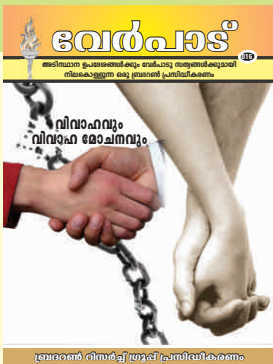
ബ്രദർമാർ നിങ്ങൾക്ക് പ്രസിദ്ധീകരണം

വേർപാടു സഭകളുടെ നന്മയും മഹത്വവും വിളിച്ചോതുന്നതിലും പ്രായോഗിക ജീവിതത്തിലും ഉപദേശ തലത്തിലുമുള്ള പരാജയങ്ങളെ വസ്തുനിഷ്ഠമായി വിശകലനം ചെയ്യുന്നതിലും വേർപാട് വാർത്താപത്രിക ശ്രദ്ധിക്കുന്നു. ദൈവജനത്തിന്റെ സഹായ സഹകരണങ്ങളാലാണ് ഈ ശുശ്രൂഷ മുന്നോട്ടു പോകുന്നത്. ആകയാൽ ഈ ശുശ്രൂഷയെ ഓർത്തു പ്രാർത്ഥിക്കുകയും വരിസംഖ്യയും സംഭാവനകളും നൽകി സഹകരിക്കുകയും ചെയ്യണമെ.