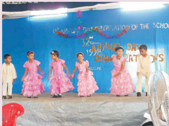
സ്കൂളിലെ കുറുന്നുകൾ അവതരിപ്പിച്ച ആക്ഷൻ സോങ്ങ്