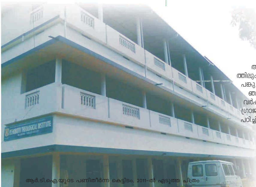
ആർ.ടി.ഐ.യുടെ പണിതീർന്ന കെട്ടിടം. 2011-ൽ എടുത്ത ചിത്രം

ആർ.ടി.ഐ.യുടെ സ്ഥാപനത്തിലും വളർച്ചയിലും ചെറിയ ഒരു പങ്കു വഹിക്കുവാനിടയായതിൽ ഞങ്ങൾ സന്തോഷിതരാണ്. ഈ വർഷം അഞ്ചാമത്തെ ബാച്ചാണ് ഗ്രാജുവേറ്റ് ചെയ്യുന്നത്. അവിടെ പഠിച്ചിറങ്ങുന്ന എല്ലാവരും തന്നെ ആത്മീയ ശുശ്രൂഷാരംഗത്ത് ശോഭിക്കുന്നു.