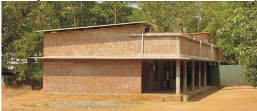
പട്ടക്കൂട് : ആർ.ടി.ഐ.യ്ക്കു വേണ്ടി പണിതുകൊണ്ടിരുന്ന കെട്ടിടം. 2004-ൽ ഇതിനകത്തു ക്ലാസ്സുകൾ നടന്നു. 2004 ലെ ചിത്രം.

കാലമത്രയും ഞങ്ങളുടെ പേർസണൽ ലൈബ്രറിയും വിദ്യാർത്ഥികൾക്ക് ലഭ്യമായിരുന്നു. സ്വന്തം പുസ്തകങ്ങൾ വിദ്യാർത്ഥികളുടെ പൊതുപ്രയോജനത്തിനായി ലോൺ നൽകു