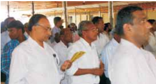
നമുക്കൊന്നായ പാടാം - സുവിശേഷകന്മാർ ഒരുമിച്ചു ഗാനം ആലപിക്കുന്നു.