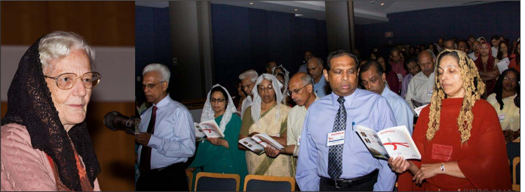
കോൺഫ്രൻസിൽ നിന്നുള്ള ദൃശ്യം

ഈ വർഷത്തെ സൗത്ത് വെസ്റ്റ് ബ്രദറൺ കോൺഫ്രൻസ് ടെക്സാസിലെ ഹൺസ് വില്ല സാം ഹ്യൂസ്റ്റൺ സ്റ്റേറ്റ് യൂണിവേഴ്സിറ്റിയിൽ വെച്ച് ജൂൺ 8 മുതൽ 10 വരെ അനുഗ്രഹീതമായി നടന്നു. നിങ്ങളുടെ വഴികളെ വിചാരിച്ചു നോക്കുവിൻ (ഹഗ്ഗായി 1:7) എന്ന തീം അടിസ്ഥാനമാക്കി കർത്തൃദാസന്മാരായ