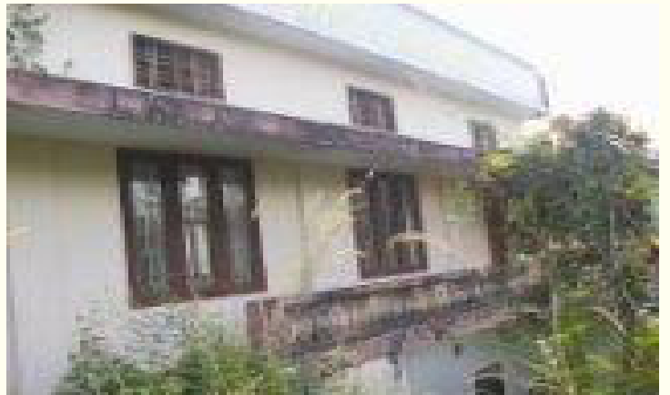
നാല് വർഷമായി അടഞ്ഞുകിടക്കുന്ന എരുമേലി ശാലോം ബ്രദറൺ സഭാഹാൾ

മതമെത്രീക്ക് കേളി കേട്ട സ്ഥലമാണ് എരുമേലി. വിരുദ്ധ വിശ്വാസമുള്ള രണ്ട് പ്രബല മതവിശ്വാസികൾ തമ്മിൽ കൈകോർക്കുന്ന സ്ഥലം. രക്ഷക്കായി ശരണം വിളിക്കുമായി ജനലക്ഷങ്ങൾ നടന്നുനീങ്ങുന്ന ഈ വഴിയോരത്ത് "യേശു ഏകരക്ഷകൻ" എന്ന മേലേഴുത്തുമായി സത്യേകരക്ഷിതാവിന്റെ ആരാധനാലയം പൂർണ്ണമായി കിടക്കുന്നത് ലോകമെങ്ങുമുള്ള ദൈവമക്കൾക്ക് ഹൃദയനൊമ്പരമാണ്. പ്രാർത്ഥിച്ചാലും!