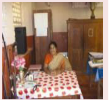
സാരാമ്മ ഇടിക്കുള (H.M. നോയൽ H.S. കുമ്പനാട്)

സമർപ്പിതരായ മാനേജുമെന്റിനൊപ്പം തിരുനാമത്വത്തിനായി, നമുക്കും പ്രാർത്ഥനയുടെ കൈകോർക്കാം.