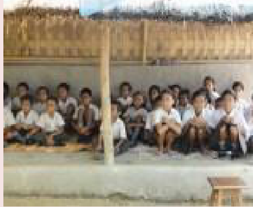
അഭയാർത്ഥി ക്യാമ്പിലെ സ്കൂൾ വിദ്യാർത്ഥികൾ