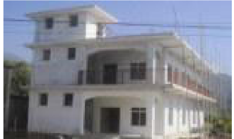
നേഷാളിലെ ധരാനിൽ നവംബർ 17-ന് ഉദ്ഘാടനം ചെയ്യുന്ന ബ്രദറൺ സഭാഹാൾ

സംഘ സമീപ സ്ഥലങ്ങളിലുള്ള വിവിധ സഭകളെ പ്രതിനിധീകരിച്ച് നിരവധി വിശ്വാസികളും സംബ