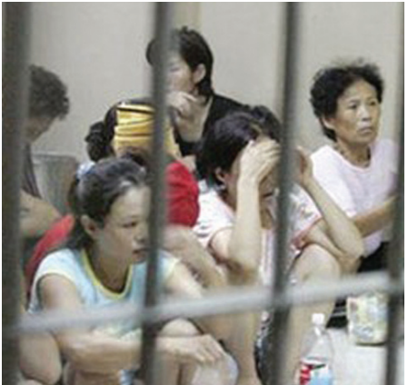
വടക്കൻ കൊറിയയിൽ ജയിലിൽ അടയ്ക്കപ്പെട്ട അഭയാർത്ഥികൾ

പീഡനങ്ങളോ വർദ്ധിച്ചുവരുന്ന സാമ്പത്തിക മാനുഷിക മാനുഷിക സഹായം നൽകുന്നതിനോ തടസ്സമാക്കി എന്ന് ഫെബ്രുവരി 20 ന് നാഷണലിസ്റ്റായിൽ നടന്ന നാഷണൽ റിലീജിയസ് ബ്രോഡ്കാസ്റ്റേഴ്സ് കൺവൻഷനിൽ അഭിപ്രായം ഉയർന്നുവന്നു. ഓരോ ക്രിസ്ത്യാനിയും പ്രശ്നങ്ങളുടെ മദ്ധ്യേ പ്രേക്ഷിത പ്രവർത്തനത്തെക്കുറിച്ച് മറുന്ന്പോകരുത്. ദൈവം നമ്മെ ഏൽപ്പിച്ച ഉത്തരവാദിത്വത്തിൽ നിന്നും മാറി നാം സുരക്ഷിതത്വം അന്വേഷിക്കുമ്പോൾ അതിലൂടെ ഉണ്ടാകുന്ന വിപരീത ഫലം ഭയാനകമാണെന്ന് ഓർക്കണം.