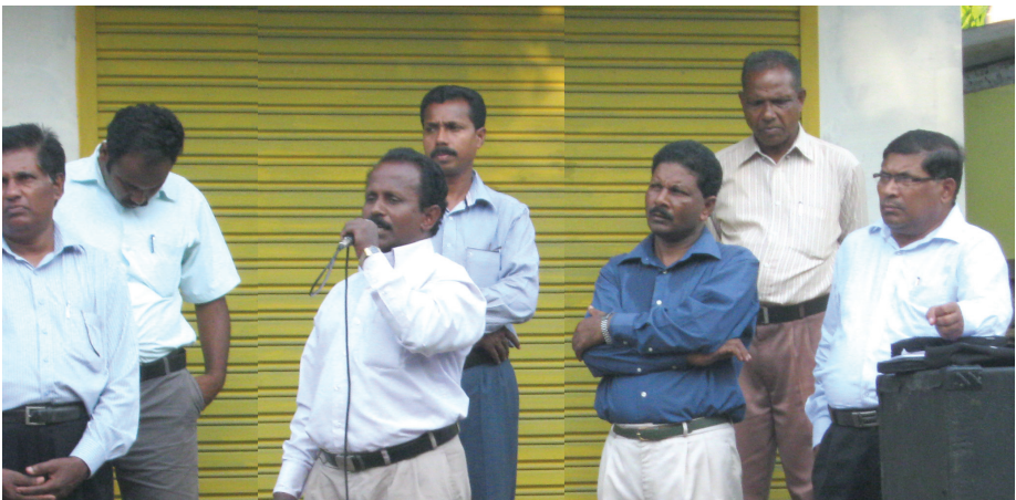
കുഴിമാവിൽ നടന്ന പ്രവർത്തനത്തിൽ നിന്ന്....