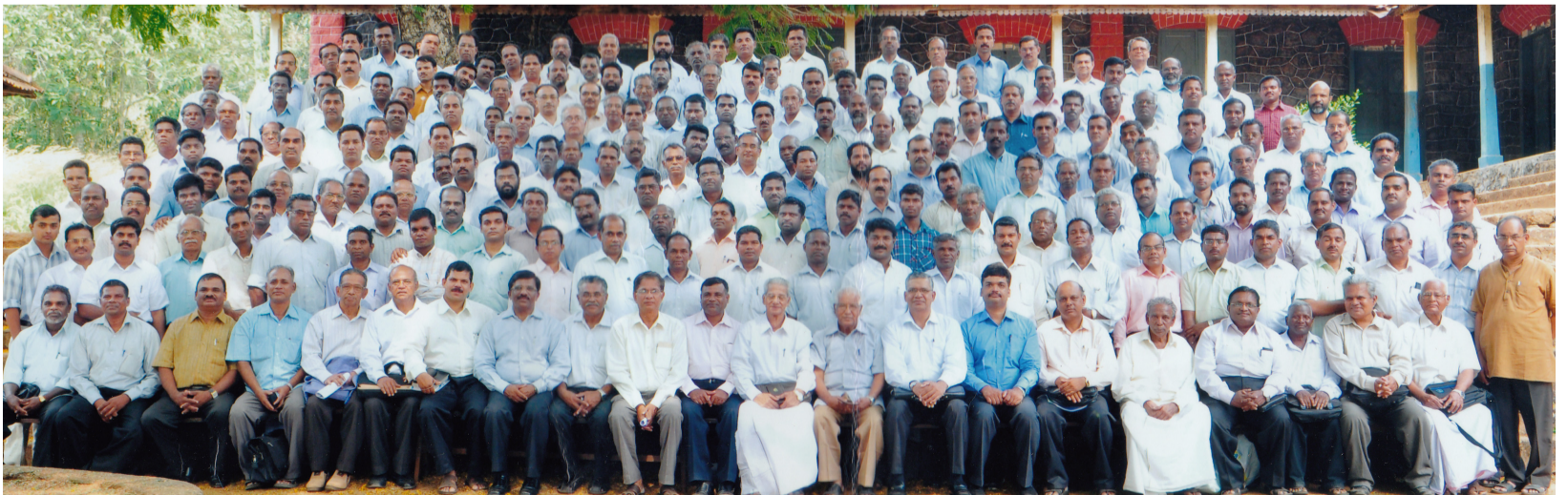
കുമ്പനാട് കൺവൻഷനോട് ബന്ധപ്പെട്ടു നടന്ന ഗോസപ്ത വർക്കേഴ്സ് മീറ്റിംഗിൽ പങ്കെടുത്തവർ

ട്ടെങ്കിലും ഹൃദയങ്ങളിൽ ആത്മീക ആവേശം കെട്ടുപോകാതിരിപ്പാൻ പ്രാർത്ഥിക്കാം. ഏറ്റുവാങ്ങിയ വചനത്തോട് പുതുവർഷത്തിൽ നീതിപുലർത്താം. അടുത്തവർഷവും ഇങ്ങനെയാരു കൺവൻഷനും സമ്മേളനവും ഉണ്ടാകുമോ എന്ന് ആരറിഞ്ഞു. നമ്മുടെ കർത്താവിന്റെ വരവ് വാതിൽക്കൽ തന്നെ... പ്രത്യുഷയോടും പുതുക്കത്തോടും കൂടെ ജീവിക്കുവാൻ കഴിഞ്ഞ കൺവൻഷൻ മുഖാന്തരമായെങ്കിൽ !