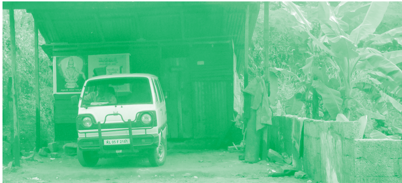
300 രൂപാ പ്രതിമാസ വാടക ലഭിക്കുന്ന മോട്ടോർ വർക്ക്ഷോപ്പ്. ആരാധനാലയത്തിലേക്കുള്ള വഴി തടഞ്ഞു സ്ഥാപിച്ചിരിക്കുന്നു.