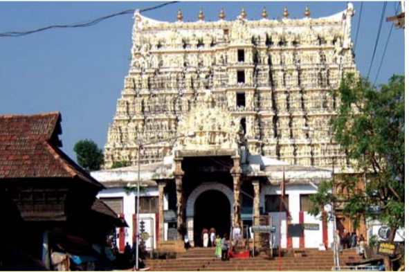
വൻ ഉത്സവത്തിന് തുടക്കമായത് സഖായിയുടെ മാനസാന്തരത്തിലൂടെയാണ്.

യേശു ജീവിതത്തിലേക്ക് വന്ന ദശാസന്ധിയിൽ അവൻ ധനത്തെ ഉപേക്ഷിക്കുവാൻ തയ്യാറായി, ക്രിസ്തു ദർശനത്തിനു മുമ്പുള്ള അവന്റെ ജീവിതത്തിന്റെ എതിർദിശയിലാണ് പിന്നീട് സഖായി സഞ്ചരിച്ചത്. ഒരു നാടിന്റെ മുഴു