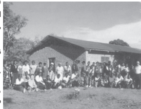
ബിഹാരു ദിവസം കൊണ്ട് നിർമ്മിച്ച ആരാധനാഹാൾ

1842 - 56 കാലഘട്ടത്തിലാണ് സ്കോട്ടിഷ് പര്യവേഷകനും ക്രിസ്ത്യൻ മിഷണറിയുമായ