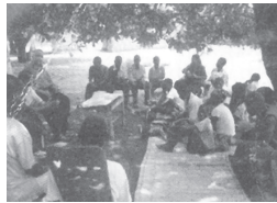
കരുമാവിൻ ചുവട്ടിൽ ആരാധന

ആഫ്രിക്ക എന്നു കേൾക്കുമ്പോൾ മനസ്സിൽ തെളിയുന്ന ബിംബങ്ങൾ യഥാർത്ഥമാവുന്ന രാജ്യമാണ് 'മലാവി'. തെക്കുകിഴക്കൻ ആഫ്രിക്കയിൽ മൊസാംബിക്, ടാൻസാനിയ, സാംബിയ എന്നിവയ്ക്കിടയിൽ സ്ഥിതി ചെയ്യുന്ന രാജ്യമാണിത്. അസാധാരണ വലിപ്പമുള്ള തടാകമാണ് മലാവി. ബ്രിട്ടീഷ് കോളനി