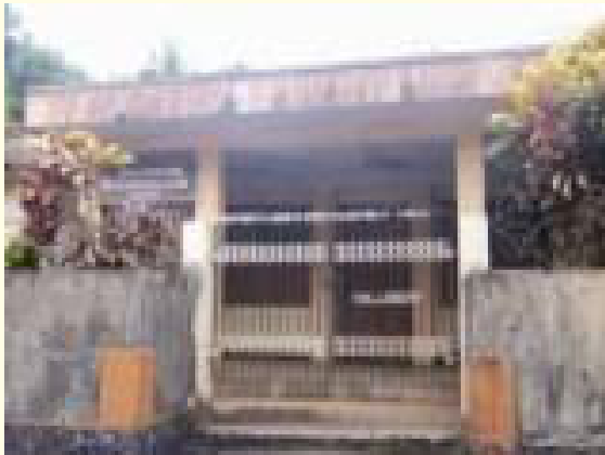
18 വർഷമായി അടഞ്ഞു കിടക്കുന്ന കല്ലിശ്ശേരി രഹബോത്ത് ബ്രദറൺ സഭാഹാൾ

കല്ലിശ്ശേരി ബ്രദറൺ സഭാഹാൾ ബ്രദറൺ സമൂഹത്തിന് നല്ല വിളവേകിയ മണ്ണാണ് കല്ലിശ്ശേരിയും ചുറ്റുപാടും. നഗ്നപാതയായി സുവിശേഷവിത്തേറിത്ത കുമ്പനാട്ടച്ചായൻ സഹിതമുള്ള നമ്മുടെ പിതാമഹന്മാരുടെ പാദസ്പർശമേറ്റ മണ്ണ്. ബ്രദറൺ സഭാചരിത്രത്തിൽ കല്ലിശ്ശേരിയ്ക്ക് അദ്ദൈവിക സ്ഥാനമാണുള്ളത്. നമ്മുടെ നമ്മുടെ സഭകളുടെ വളർച്ചയ്ക്കും നിലനിൽപ്പിനും ഈ മേഖലയിലെ സഭകളുടെയും സഹോദരി സഹോദരന്മാരുടെയും സാന്നിധ്യത്തിലും സമ്പത്തിനും നിർണ്ണായക പങ്കാണുള്ളത്.