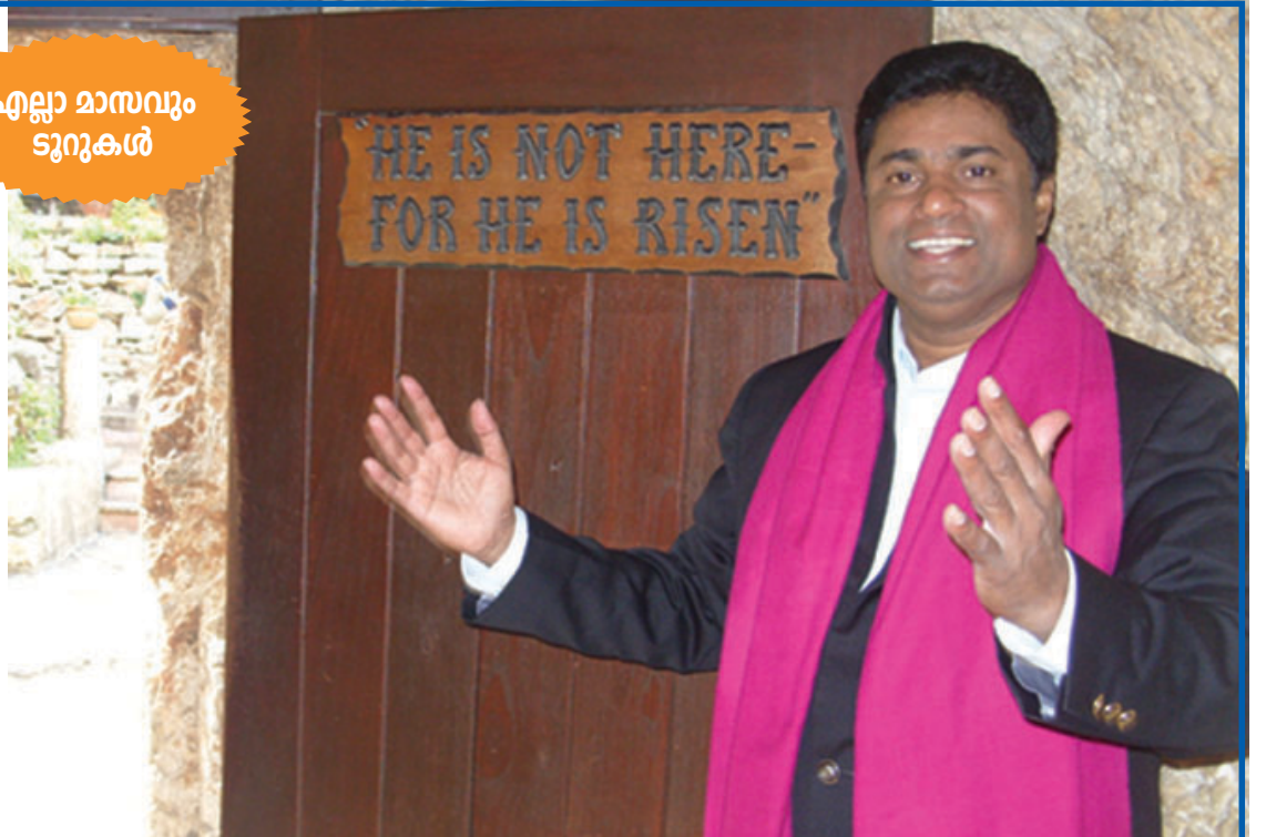
"അവൻ ഉയിർത്തെഴുന്നേറ്റു; അവൻ ഇവിടെ ഇല്ല; അവനെ വച്ച സ്ഥലം ഇതാ" യെരൂശലേമിൽ യേശുവിനെ അടക്കം ചെയ്ത കല്ലറയ്ക്ക് സമീപം അച്ചൻകുഞ്ഞു ഇലന്തൂർ