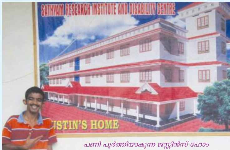
പണി പൂർത്തിയാകുന്ന ജസ്റ്റിൻസ് ഹോം

കറുത്തവരോ, വെളുത്തവരോ, ഇരുനിറത്തിലുള്ളവരോ ഉയർന്നവരോ താഴ്ന്നവരോ ഭേദമില്ലാതെ എല്ലാ കുഞ്ഞുങ്ങളും ദൈവത്തിന്റെ ദാനമാണ്. ഈ കുഞ്ഞുങ്ങളെ ദൈവം നമുക്കു നൽകിയിരിക്കുന്നത് അവരെ സ്നേഹിക്കുവാനും, പോറ്റുവാനും, ദൈവഭയത്തിൽ വളർത്തുവാനുമാണ്. തങ്ങളുടെ കുഞ്ഞുങ്ങൾ വളർന്ന് സമൂഹത്തിൽ ബഹുമാനമർഹിക്കുന്ന വ്യക്തിത്വത്തിനുമകളായിത്തീരണം എന്ന് എല്ലാ മാതാപിതാക്കളും ആഗ്രഹിക്കുന്നു. നിങ്ങൾ