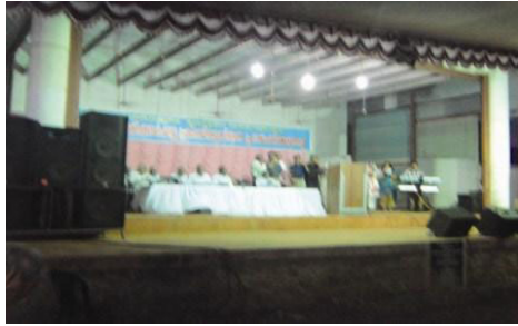
കോട്ടയം കൺവൻഷൻ വേദി ഒരു ദൃശ്യം

കമാളുകൾ സുവിശേഷ പ്രഭാഷണങ്ങൾ ശ്രദ്ധിക്കുന്നുവെന്നത് കോട്ടയം കൺവൻഷന്റെ സവിശേഷതയാണ്. അവരിൽ