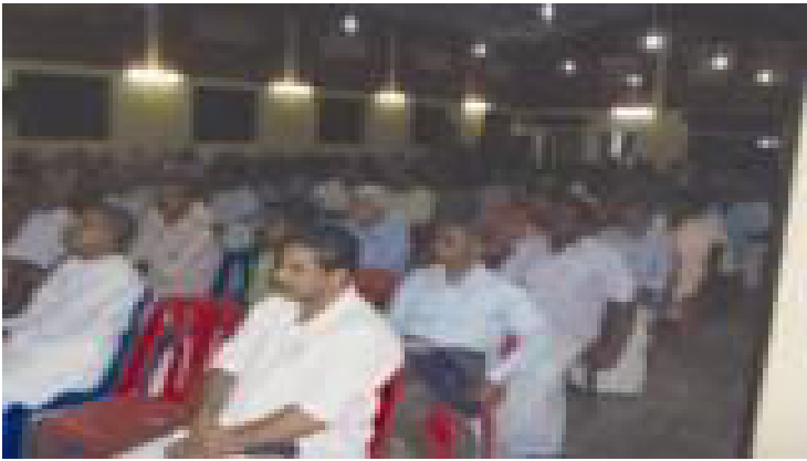
റാന്നി ബ്രദറൺ കൺവൻഷൻ വചനം ശ്രവിക്കുന്നവർ

റാന്നി കൺവൻഷൻ, സീയോൻ കുന്നിൽ ആർ.സി.സി.എസ് ആ ഡിറ്റോറിയം നിലവിൽ വന്ന തോടെ സ്ഥിരവേദി അതായി. 2000 ൽ കൺവൻഷന്റെ ശതാബ്ദിയായിരുന്നു. 2011 ൽ എത്തി നിൽക്കുമ്പോൾ ദൈവം നടത്തിയ മനോജ്ഞങ്ങളായ 111 വർഷത്തെ ചരിത്രസ്മരണകളാണ് പൂർണ്ണമായിരിക്കുന്നത്.