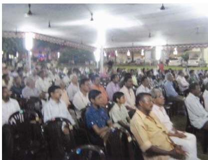
'ശ്രദ്ധയോടെ' വചനം ശ്രവിക്കുന്ന വിശ്വാസികൾ